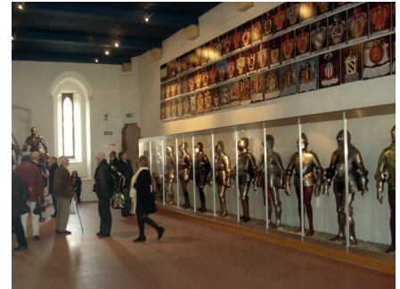
Wappen der Vögte von Grandson

Neben einer aussergewöhnlichen Sammlung von Waffen und Rüstungen, Armbrüsten und diversen Vitruinen mit Modellen der Schlachten von Grandson und Murten sowie Teilen der Beute besichtigten wir die Folterkammer und den edlen Rittersaal aus dem 17. Jh. mit dem reich geschnitzten Chorgestühl aus Bergamo.