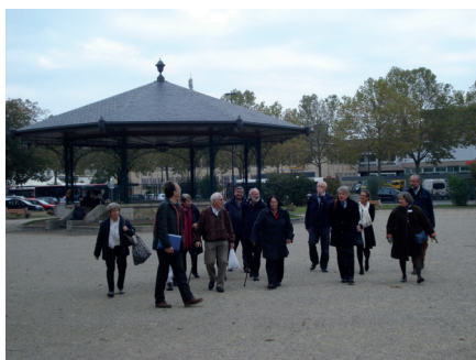
Visite de la ville

Au café, sur la place de la gare d'Yverdon-les-Bains, nous décidons de renoncer à la terrasse, décidément un peu fraîche. La plupart des places assises du petit café furent alors prises d'assaut par une bonne trentaine de participant-e-s, attiré-e-s par les grands roll-ups de la SSEG placés bien en vue. Malgré quelques rares petites gouttes de pluie, la journée fut très agréable avec même quelques rayons de soleil, ce qui ne gâcha rien.