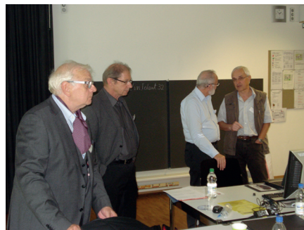
Experten im Gespräch

gegeben. Natürlich gibt es dabei trotzdem noch das eine oder andere 'Aber'. Nicht jedes Programm kann alle Daten einer entsprechenden Datei verarbeiten.