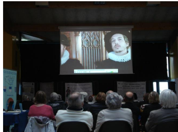
Die Filmprojektion / la projection du film

co-produziert durch die SRG, erzählt wie die Genfer in 1602 den Angriff der Savoyarden widerstanden und welchen Beitrag die Mère Royaume mit ihrem Suppentopf leistete. Als Anerkennung wird ja jedes Jahr im Dezember in Genf die Escalade gefeiert. Symbolisch werden in Freunden- und Familienkreisen Kochtöpfe der Mère Royaume aus Schokolade, gefüllt mit Gemüse aus Marzipan, mit dem Spruch „So kamen die Feinde der Republik zu Tode“ mit einem Schwert oder in Ermangelung eines Besseren mit den Fäusten zerschlagen und genüsslich verspiessen.