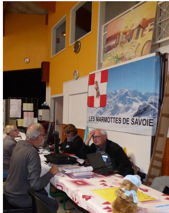
Der Stand der Marmottes / le stand des Marmottes

Da konnte auch beobachtet werden, dass es in Frankreich sogar eine Gesellschaft gibt (GenVerrE – Généalogie des Verriers d'Europe), die sich auf die Familien der Glasmacher konzentrieren ( www.genverre.com ). Werden wir nach dem Erscheinen des Jahrbuches der Waadtländer 2014 bald eine Gesellschaft der Uhrmacherfamilienforscher haben? Warum nicht ?