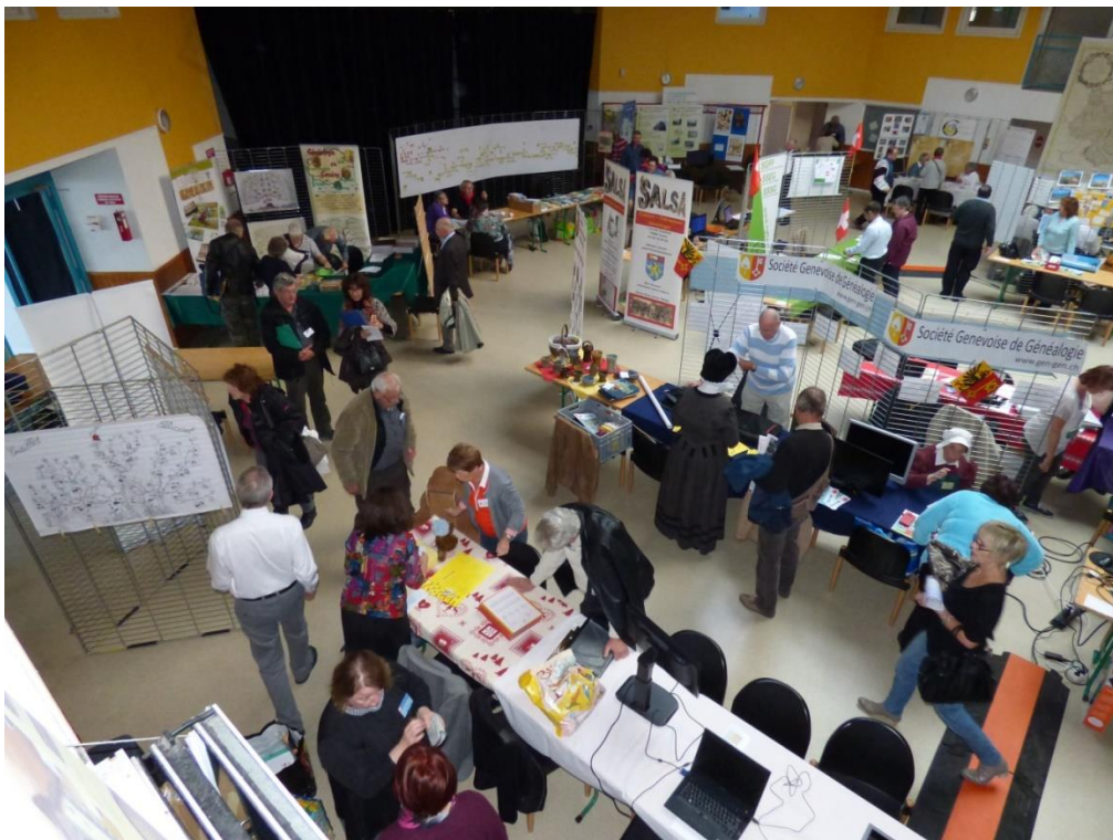
Ein Teil der Ausstellung / Vue sur une partie de l'exposition