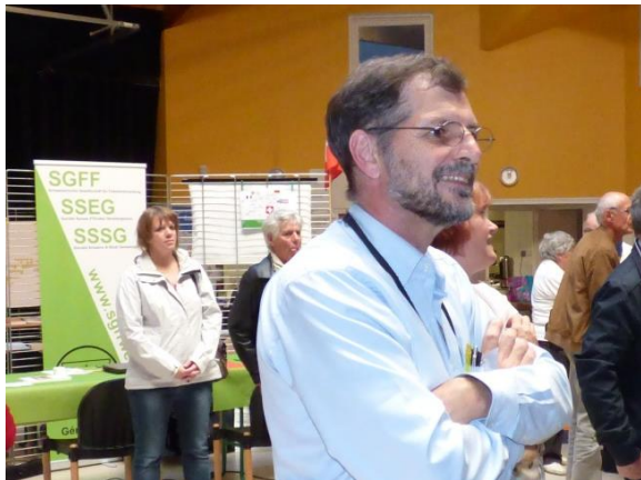
Der SGFF-Vize und sein Stand / Le vice-président de la SSEG devant son stand

Les deux jours d'exposition furent l'occasion de s'échanger entre chercheurs de France lointaine et proche (Bretagne, Corrèze, Haute-Saône, Haut-Jura, etc.) ainsi qu'avec les visiteurs de la région. Il fut ainsi possible de constater qu'il existe en France une société (GenVerrE – Généalogie des Verriers d'Europe) qui se concentre sur l'étude des familles de verriers ( www.genverre.com ). La sortie de la Revue vaudoise de généalogie et d'histoire des familles 2014, consacrée à la famille et à l'industrie horlogère, aura-t-elle pour effet de lancer l'idée d'une société spécialisée dans la généalogie des horlogers ? Pourquoi pas, en fait ?