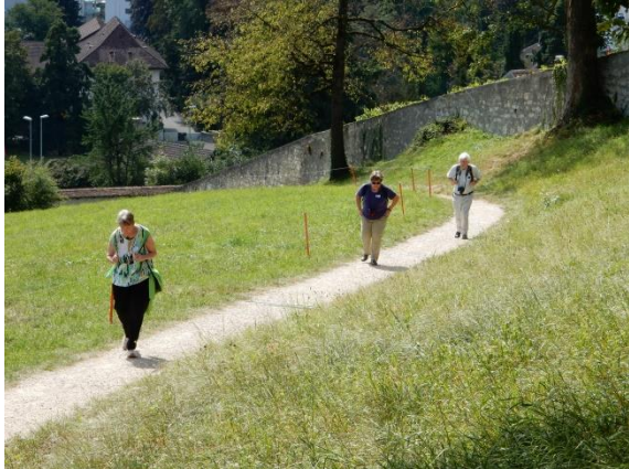
Aufstieg zum Schloss Wildegg